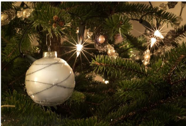
Door het kleine diafragma, hier is met f/16 gefotografeerd, krijgen de kerstlampjes een stervorm. Het is een leuk effect maar wel wat hard.

Je kunt ook het tegengestelde proberen door met een bijna dichtgedraaid diafragma te fotograferen bijvoorbeeld op F22. I.p.v. de glinsterende zachte vlekjes op de achtergrond