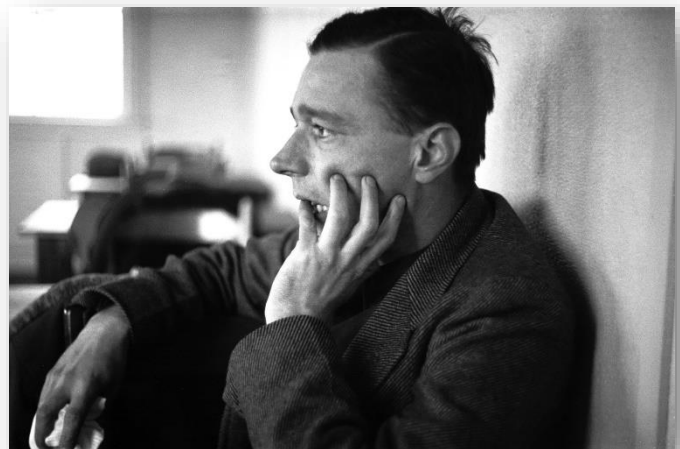
Walker Evans studeerde literatuur alvorens hij in 1928 besloot om fotograaf te worden.

Walker Evans (1903-1975) is misschien wel één van de bekendste fotografen van de twintigste eeuw. Zijn foto's behoren tot de meest iconische beelden van de moderne fotografie. Direct en genereus, analytisch maar toch lyrisch, zorgvuldig gecomponeerd, maar niet geforceerd. Zijn manier van werken is tot op de dag van vandaag een inspiratie voor velen. Lees meer over deze tentoonstelling